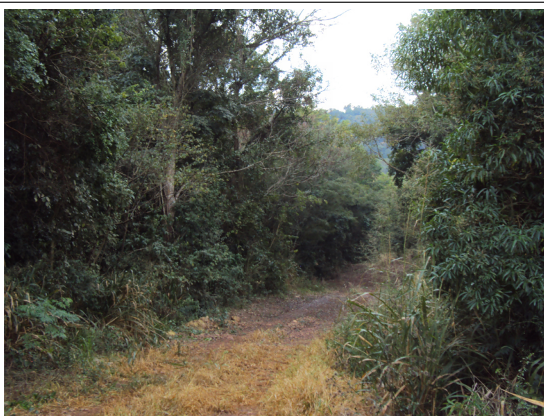
Figura 3 Representação da vegetação no ponto amostral FT3.

Para a amostragem de anfíbios e répteis foi utilizado armadilha de intercepção e queda, censo por transecção, busca ativa, registros ocasionais e entrevistas.