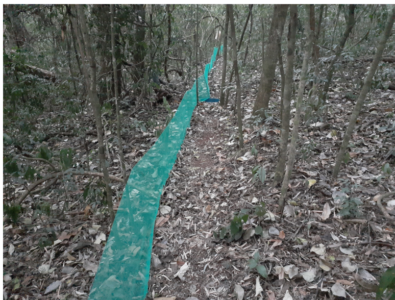
Figura 4 Armadilha de interceptação e queda sendo instalada no ponto amostral FT1.

O método de busca ativa foi realizado no período noturno através da investigação de um ambiente específico, como brejo e margem do rio, focando na busca por anuros (figura 5). Neste método a equipe investigava o local com auxílio de lanternas, câmera fotográfica e gravador de som portátil. Todos os espécimes identificados por visualização e/ou vocalização eram registrados e quando possível fotografados. Em caso de grande número de indivíduos anuros vocalizando, sua quantidade era estimada por intervalos (por exemplo: 1 a 5 indivíduos, 5 a 10 indivíduos, 10 a 20 indivíduos). Em caso de dificuldade de identificação de espécime pela vocalização, esta era gravada para posterior análise em banco de dados. Este método foi aplicado por uma hora em cada ponto amostral.