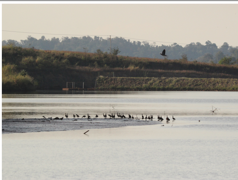
Figura 8 Bando de Dendrocygna viduata (irerê) em baixio no reservatório da CGH Ouro Branco.

Associado ao ambiente aquático, aqui referindo-se à área de várzea na margem esquerda do rio Mourão e ao próprio reservatório da CGH Ouro Branco, ocorreram ao todo 58 espécies, uma riqueza expressiva e que coloca