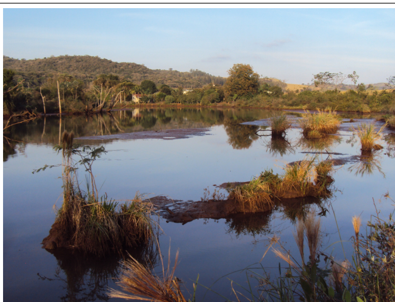
Figura 2 Área de várzea formada pelo barramento das águas do rio Mourão, no ponto amostral FT2.

Situa-se na área do reservatório, sob as coordenadas UTM 22 J 373628.38 m E e 7345155.10 m S. A principal característica deste ponto é a presença de uma ampla área de várzea, formada pelo enchimento do reservatório e hoje estabelecida como área de preservação permanente