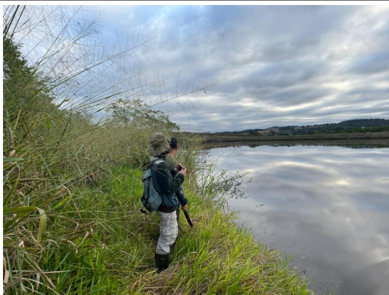
Figura 7 Representação do método de censo por transecção no ponto amostral FT2.

Foram percorridas trilhas para a realização de censos por transecção em todos os pontos de amostragem. Realizaram-se dois diferentes transectos em cada ponto amostral, sendo um no período matutino e outro vespertino, com duas horas de duração cada (figura 7).