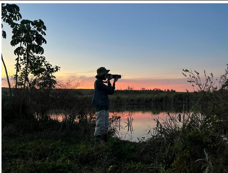
Figura 5 Execução do método de busca ativa para amostragem do ambiente de várzea no ponto amostral FT2.

O método também foi aplicado no período noturno para amostragem de aves notívagas. Neste caso, estabeleceu-se uma hora de buscas em áreas de mata e bordas, com auxílio de lanternas e da técnica de playback. Parte da amostragem também era realizada deslocando-se lentamente com veículo automotivo pelas vias de terra para buscas de caprimulgídeos, que comumente dispõem-se nestes locais.