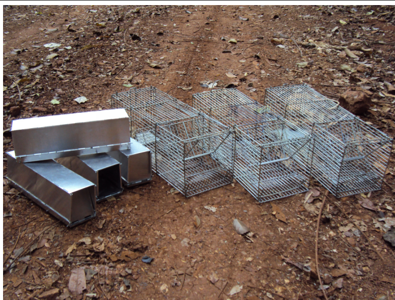
Figura 6 Armadilha modelos Sherman e Tomahawk utilizadas para amostragem de pequenos mamíferos.

Utilizaram-se armadilhas tipo Tomahawk e Sherman, sendo voltadas principalmente para a captura de pequenos roedores e marsupiais, terrícolas e arborícolas. Cada ponto amostral obteve sete armadilhas (três unidades do modelo Tomahawk e quatro unidades do modelo Sherman), totalizando 21 unidades por campanha. As