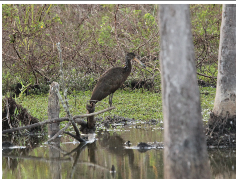
Figura 9 Aramus guarauna (carão) registrado no ambiente de várzea do ponto amostral FT2.

O ponto amostral FT3 exibiu a soma de 53 espécies registradas, tendo as mais abundantes Patagioenas picazuro (pomba-asa-branca), Basileuterus culicivorus (pula-pula) e Turdus leucomelas (sabiá-barranco). Entre outras espécies registradas no ponto estão Baryphtengus ruficapillus (juruva),