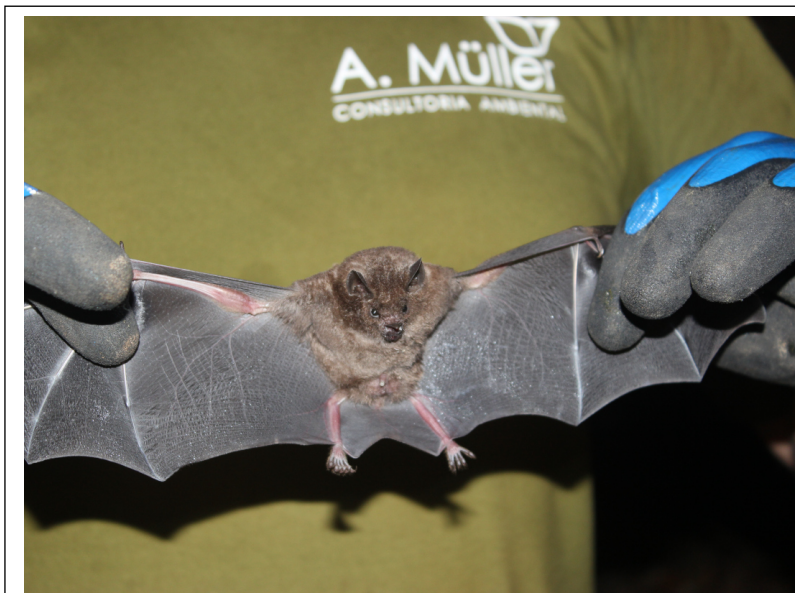
Figura 10 Carollia perspicillata capturado no ponto amostral FT1.

Cerdocyon thous (cachorro-do-mato) e bando de Nasua nasua (quati) com cinco indivíduos. Em caminhamentos em borda da mata ciliar do rio Mourão avistarem-se dois indivíduos Hydrochoerus hydrochaeris (capivara), além de diversas pegadas do roedor, e também um exemplar Lepus europaeus (lebre), uma espécie exótica e invasora. As amostragens de