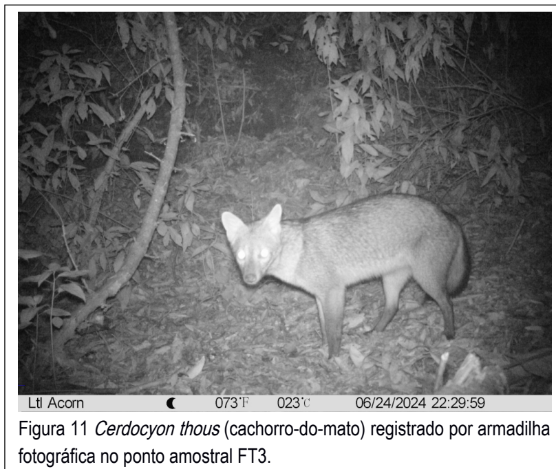
Figura 11 Cerdocyon thous (cachorro-do-mato) registrado por armadilha fotográfica no ponto amostral FT3.

O ponto amostral FT3 obteve sete espécies de mamíferos registradas, destacando-se Cuniculus paca (paca). O roedor é um importante registro por se tratar de uma espécie pouco frequente em decorrência de suas exigências ambientais e por se encontrar ameaçada no Parana (categoria “vulnerável”), sendo grande vítima da caça ilegal (Tiepolo & Quadros, 2025). Já é reconhecida a prática frequente da caça na área de influência e nesta campanha este atributo se reafirmou através do encontro de cartuchos de munição no ponto